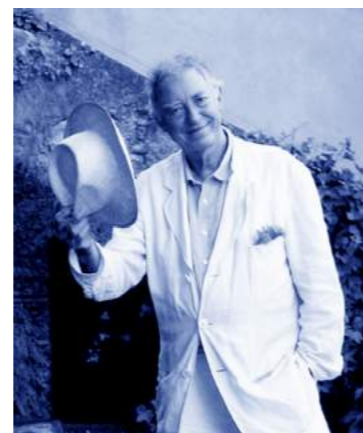
Jean-Michel Folon

Né à Bruxelles le 1 er mars 1934, Jean-Michel FOLON passe sa jeunesse en Belgique. Son père exerce la profession de marchand de papier, une ambiance que Folon gardera en mémoire: « C'est là que j'ai sans doute commencé à dessiner ». Folon décide très tôt qu'il sera illustrateur et dessinateur, mais son talent ne connaîtra pas de frontières . Peintre, aquarelliste, graveur, concepteur d'affiches, il réalise également des films et des dessins animés, crée des décors pour l'opéra et le théâtre, élabore des mosaïques et des vitraux... Il nous raconte avec son personnage, l'homme bleu, des histoires de liberté, de voyage et de rencontres . En 2000, il ouvre, dans le merveilleux parc Solvay, à La Hulpe, la Fondation qui porte son nom et qui présente plus de 500 œuvres. Folon est mort en 2005 en nous laissant ce fabuleux musée et des images pleines de rêves.