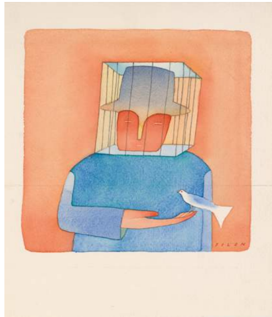
Les droits de l'homme, article 20 Peinture, 1988, 28 x 24,5 cm ©Fondation Folon, 2018

Principal personnage de l'œuvre de Folon, l'homme bleu est un héros universel . Il est le plus souvent profondément seul, égaré dans les méandres des grandes villes ou assis devant la mer. Il lui arrive cependant de se démultiplier, car c'est bien l'humanité toute entière qu'il représente. Nul n'est plus banal que lui, et pourtant il est capable de tous les exploits, en premier lieu celui de s'envoler !